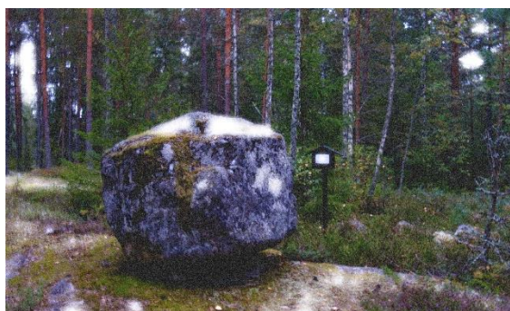
Häxstenen i Tingstorp

Domstolarnas arbete måste ha varit svårt. Många häxor blev frikända i brist på bevis. Men det räckte med hädelse och gudsförnekelse som orpareragrafen utgick först med 1864 års strafflag. Kanske är det så att den märkliga stenen i Ervalla har en ännu mera spännande historia. Det är ju välkänt att religioner utvecklats från forntidens mera primitiva till dagens många gånger avancerade trosföreställningar. I den grå forntiden tillbad man träd och egendomligt formade stenar. Är Tingstorpsstenen en av dessa förhistoriska kultplatser? Vi lär väl aldrig få veta. Men det kan ju mycket väl vara troligt.